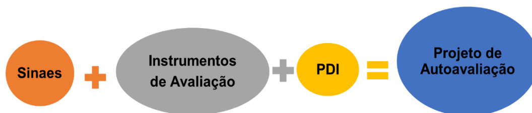
Figura 1: Documentos utilizados para a elaboração do Projeto de Avaliação Institucional.

O projeto de avaliação utilizado no Centro Universitário de Itajubá foi elaborado com base nos documentos fornecidos pelo MEC e o PDI. A Figura 1 ilustra quais os documentos são utilizados na formulação desse projeto.